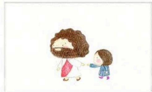
"신자들이 내년에 주님을 도래하여 기다리다... 그분과 같은 매일이신다는 새롭습니다..."

일정: 10월 1일(화) 새벽 0시 30분 ~ 10월 12일(토) 12박 13일 (기내 1박) 비행출발이 10/01/2024 0:30AM 이므로 9월 30일 저녁 9시에는 공항에 도착해야 합니다. 지도신부: 이가별 가브리엘 신부님 참가비: $2,790 + 항공료 인원: 선착순 35명 문의: 황영원 가브리엘라 ☎ 646-298-4883 강미연 셀리나 ☎ 917-968-4190