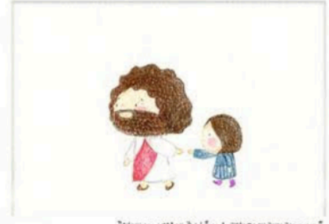
"산토리니- 나환자 주님들께 노래하며 다룬다(산토리니)" 그분과 같은 매일이신나는 사랑입니다...

“저의 하느님, 저의 하느님, 어찌하여 저를 버리셨습니까?” (마태 26,46)