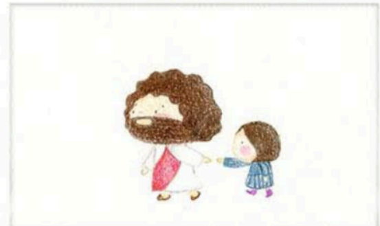
"선제나니 내맘에 주님을 노래하며 따라가리(amen)" 그분과 걷는 매일이신나는 여행길이길...

❖ 튀르키예(터키), 그리스-산토리니 성지순례 일정: 10월 1일(화) 새벽 0시 30분 ~ 10월 12일(토) 12박 13일 (기내 1 박) 비행출발이 10/01/2024 0:30AM 이므로 9월 30일 저녁 9시에는 공항에 도착해야 합니다. 지도신부: 이가별 가브리엘 신부님 참가비: $2,790 + 항공료 인원: 선착순 35명 문의: 황영원 가브리엘라 ☎ 646-298-4883 강미연 셀리나 ☎ 917-968-4190